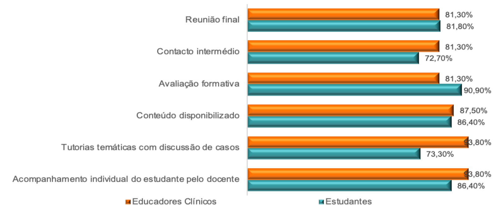
Gráfico 3: Práticas que contribuem para o bom funcionamento das unidades curriculares de estágio na opinião dos estudantes e dos educadores clínicos.

Na opinião dos estudantes e dos educadores clínicos a maior parte das práticas pedagógicas contribuem para o bom funcionamento das unidades curriculares de Educação para a Prática, nomeadamente as identificadas no gráfico 3. Destacam-se, com valores acima de 90%, a ‘avaliação formativa’, as ‘tutorias de discussão de casos clínicos’ e o ‘acompanhamento individual do estudante’.