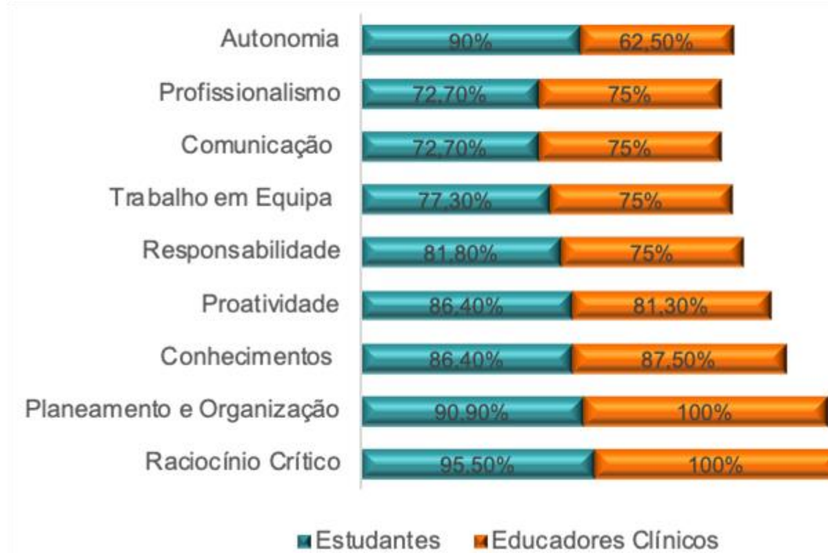
Gráfico 2: Impacto das práticas pedagógicas no desenvolvimento de competências na opinião dos estudantes e dos educadores clínicos.

Grande parte dos estudantes e educadores clínicos consideram “muito importante” as práticas pedagógicas utilizadas na unidade curricular para o desenvolvimento de competências pessoais e profissionais. Conforme se verifica no gráfico 2 o ‘raciocínio crítico’ foi destacado pela quase totalidade dos intervenientes.